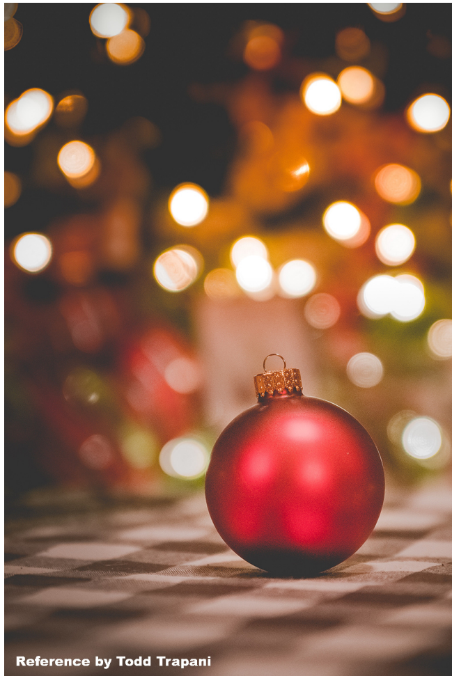
Reference by Todd Trapani