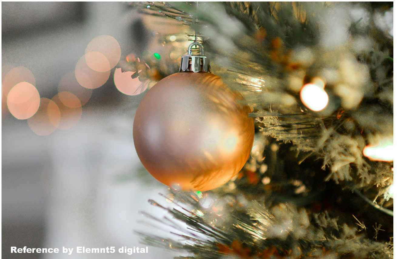
Reference by Elemnt5 digital